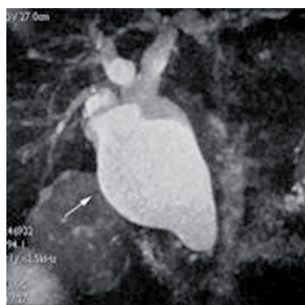
РИС. 5. МРХПГ. (I ТИП - КИСТОЗНОЕ РАСШИРЕНИЕ ОБЩЕГО ЖЁЛЧНОГО ПРОТОКА)

Следует подчеркнуть, что полученные результаты свидетельствуют о высокой информативности МРПХГ при КТЖП, который позволяет визуализировать жёлчные протоки без введения контрастных препаратов. На тонких и толстых срезах при МРПХГ в трёхмерном изображении были отчетливо видны как неизмененные, так и аномально трансформированные внутри- и внепечёночные протоки.