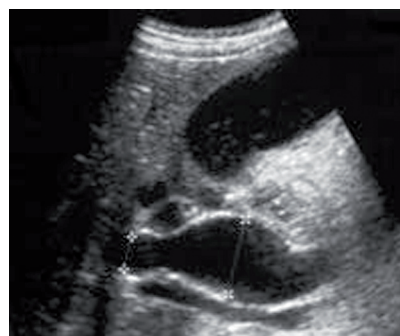
РИС. 2. УЗИ. КИСТА ХОЛЕДОХА (ТИП I). ВЕРЕТЕНООБРАЗНАЯ ДИЛАТАЦИЯ ОБЩЕГО ЖЕЛЧНОГО ПРОТОКА

РЕЗУЛЬТАТЫ И ИХ ОБСУЖДЕНИЕ. При поступлении всем пациентам выполняли УЗИ печени, жёлчного пузыря, внутри- и внепечёночных протоков, поджелудочной железы. Эхографически киста общего жёлчного протока определялась как округлое или овальное анэхогенное образование, локализующееся в области головки поджелудочной железы и несвязанное с жёлчным пузырём (рис. 2). В 6 случаях исследование позволило выявить расширение ОЖП и определить его форму (мешковидный, веретенообразный) и диаметр (10-95 мм), в том числе в 4-х случаях эхография выявила наличие конкрементов различных размеров в просвете кистозно-расширенного протока. В одном из наблюдений отмечалось расширение внутрипечёночных жёлчных протоков с наличием множественных конкрементов (рис. 3). При УЗИ жёлчный пузырь также был значительно увеличен в размерах, стенки утолщены до 4-5 мм, при этом визуализировались конкременты у 5-ти больных.