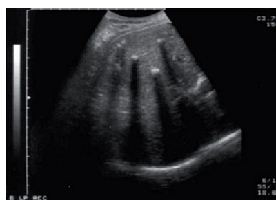
РИС. 3. УЗИ. СИНДРОМ КАРОЛИ (ТИП V). РАСШИРЕННЫЕ ВНУТРИПЕЧЕНОЧНЫЕ ЖЕЛЧНЫЕ ПРОТОКИ С МНОЖЕСТВЕННЫМИ КОНКРЕМЕНТАМИ

ЭРХПГ была наиболее информативным и достоверным методом диагностики при КТЖП. Она была выполнена 5 больным. Изолированное расширение ОЖП с умеренным расширением ОПП обнаружено в 3-х наблюдениях. У всех больных контрастировался гепатикохоледох диаметром 1,5-10 см (рис. 4). Расширение внутрипечёночных протоков с вовлечением сегментарных протоков выявлено у одного пациента. В 3-х случаях, данное исследование привело к обострению холангита, прогрессированию желтухи и необходимости срочного наружного дренирования жёлчных протоков или операции. Поэтому, в настоящее время, мы практически не выполняем ЭРХПГ при кистах жёлчных протоков.